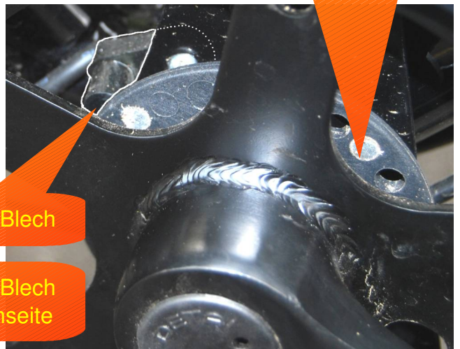
Nehmer am Blech an der Innenseite