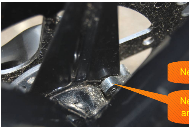
Nehmer am Blech