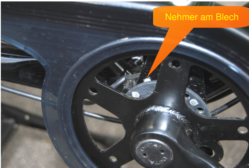
Nehmer am Blech